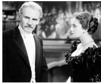
1935 RHODES L'AFRICAIN (Rhodes of Africa) de Berthold Viertel avec Peggy Ashcroft