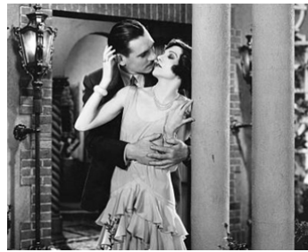
1929 UNE FEMME A MENTI (The Lady Lies) d'Hubert Henley avec Claudette Colbert