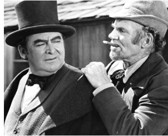
1940 TOUS LES BIENS DE LA TERRE (All that Money can buy) de William Dieterle avec Edward Arnold