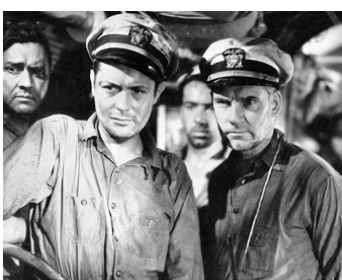
1933 CONFLITS (Hell Below) de Jack Conway avec Robert Montgomery