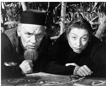
1944 LES FILS DU DRAGON (Dragon Seed) d'H. Bucquet & J. Conway avec Alice MacMahon