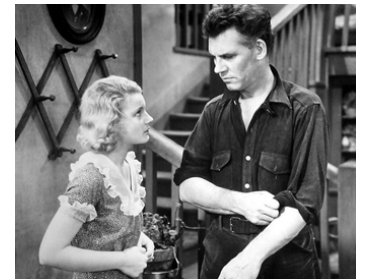
1931 ORAGES (A House divided) de William Wyler avec Helen Chandler