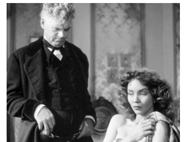
1946 DUEL AU SOLEIL (Duel in the Sun) de King Vidor avec Jennifer Jones