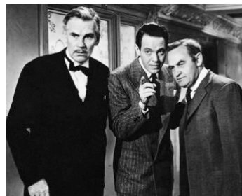
1945 DIX PETIS INDIENS (And then there were none) de R. Clair avec Louis Hayward, Barry Fitzgerald