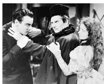
1933 RHAPSODIE AMOUREUSE (Storm at Daybreak) de R. Boleslawski avec Nils Asther, Kay Francis