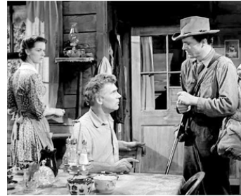
1941 L'ÉTANG TRAGIQUE (Swamp Water) de Jean Renoir avec Anne Baxter, Dana Andrews