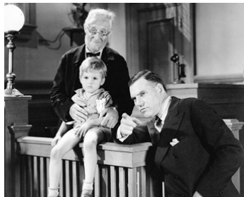
1931 LE REDOUTABLE TÉMOIN (The Star Witness) de William A. Wellman avec Charles Chic Sale