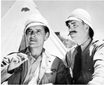
1939 LA LUMIÈRE QUI S'ÉTEINT (The Light that failed) de W. Wellman avec Ronald Colman