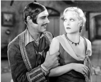
1930 THE BAD MAN de Clarence G. Badger avec Dorothy Revier