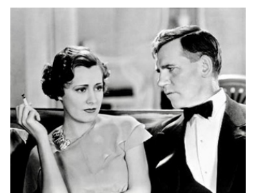
1934 ANN VICKERS (Ann Vickers) de John Cromwell avec Irene Dunne