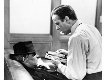
1941 LE FAUCON MALTAIS (The Maltese Falcon) de John Huston avec Humphrey Bogart