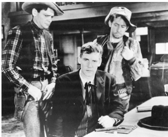
1931 LES MOUSQUETAIRES DE L'OUEST (Law and Order) d'E. Cahn avec Raymond Hatton