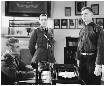
1934 KEEP' EM ROLLING de George Archainbaud avec Frank Conroy, Robert Shayne