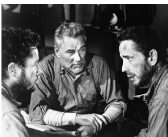
1948 LE TRÉSOR DE LA SIERRA MADRE de John Huston avec Tim Holt, Humphrey Bogart