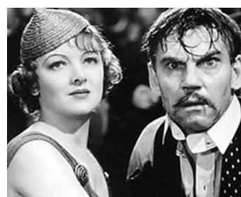
1933 UN CŒUR, DEUX POINGS (The Prizefighter and the Lady) de W. S. Van Dyke avec Myrna Loy