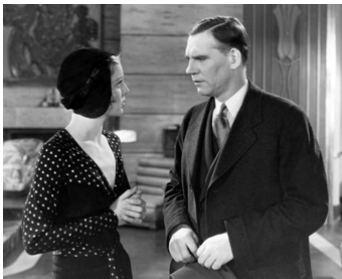
1931 THE RULING VOICE de Rowland V. Lee avec Loretta Young