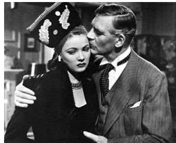
1941 SHANGHAÏ (The Shanghai Gesture) de Josef von Sternberg avec Gene Tierney