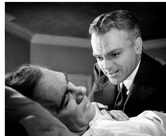
1942 LA GLORIEUSE PARADE (Yankee Doodle Dandy) de Michael Curtiz avec James Cagney