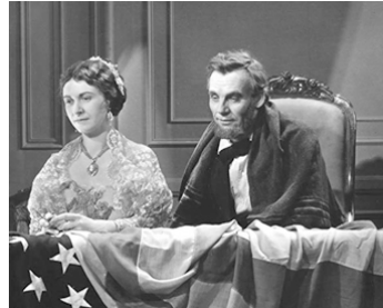
1930 ABRAHAM LINCOLN (Abraham Lincoln) de David W. Griffith avec Kay Hammond