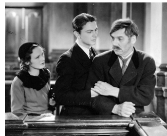
1931 RÉGIME SEC (The Wet Parade) de Victor Fleming avec Dorothy Jordan, Robert Young