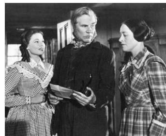
1945 LE CHÂTEAU DU DRAGON (Dragonwyck) de J. Mankiewicz avec Gene Tierney, Anne Revere