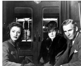
1943 MISSION À MOSCOU (Mission to Moscow) de M. Curtiz avec Eleanor Parker, Ann Harding