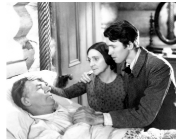
1937 OF HUMAN HEARTS de Clarence Brown avec Beulah Bondi, James Stewart