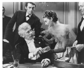
1948 PASSION FATALE (The great Sinner) de Robert Siodmak avec Gregory Peck, Ava Gardner