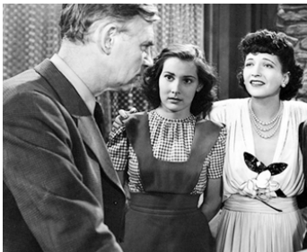
1941 TOUJOURS DANS MON CŒUR (Always in my Heart) de J. Graham avec Gloria Warren, Kay Francis