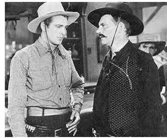
1929 LE VIRGINIEN (The Virginian) de Victor Fleming avec Gary Cooper