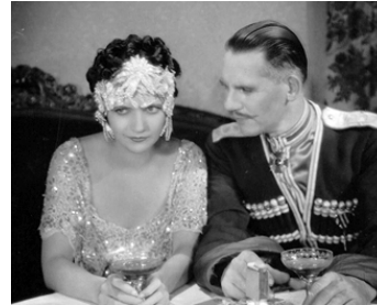
1930 LE REBELLE (Virtuous Sin) de George Cukor & Louis J. Gasnier avec Kay Francis