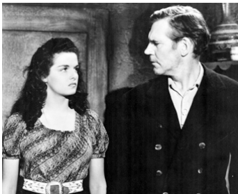
1942 LE BANNI (The Outlaw) de Howard Hughes avec Jane Russell