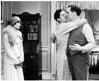
1929 GENTLEMEN OF THE PRESS d'Harry Webb avec Betty Lawford, Kay Francis