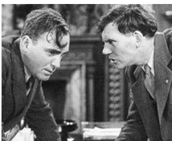
1932 LA RUÉE (American Madness) de Frank Capra avec Pat O'Brien