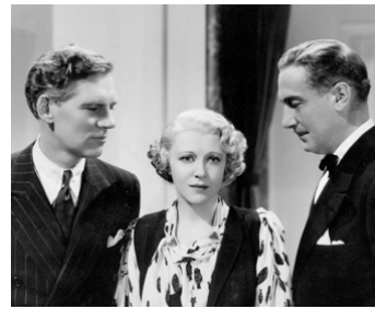
1936 DODSWORTH (Dodsworth) de William Wyler avec Ruth Chatterton, Paul Lukas