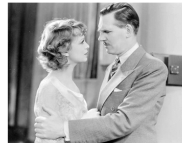
1932 FAITS DIVERS (Night Court) de W. S. Van Dyke avec Noel Francis