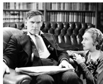
1932 GABRIEL OVER THE WHITE HOUSE de Gregory La Cava avec Karen Morley