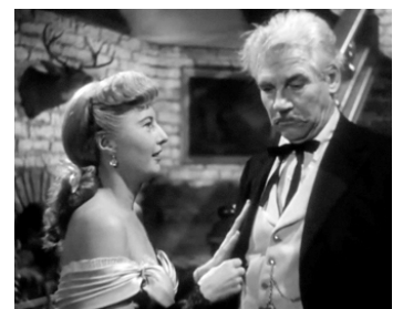
1950 LES FURIES (The Furies) d'Anthony Mann avec Barbara Stanwyck