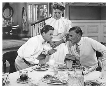
1947 BELLE JEUNESSE (Summer Holiday) de Rouben Mamoulian avec Mickey Rooney, A. Moorehead