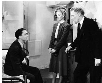
1943 L'ANGE DES TÉNÉBRES (Edge of Darkness) de L. Milestone avec John Beal, Ann Sheridan