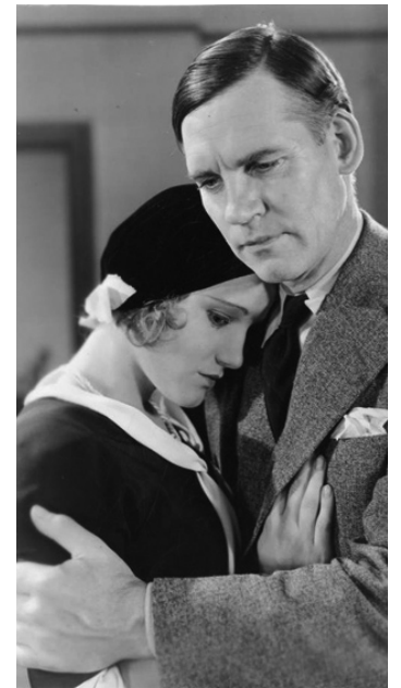
1930 LE CODE CRIMINEL (The Criminal Code) d'Howard Hawks avec Constance Cummings