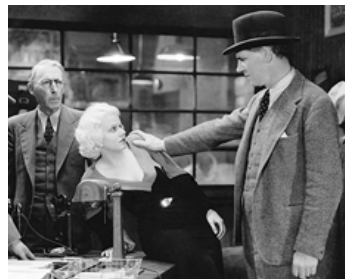
1931 LA BÊTE DE LA CITÉ (The Beast of the City) de Ch. Brabin avec Tully Marshall, Jean Harlow