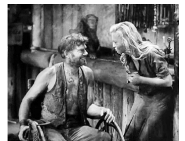
1932 CONGO (Kongo) de William J. Cowen avec Virginia Bruce