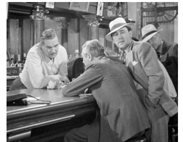
1942 L'AMOUR N'EST PAS UN JEU (In this our Life) de John Huston avec John Hamilton